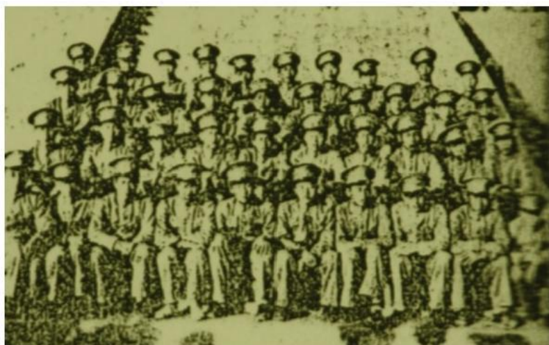
高中应化科一年级