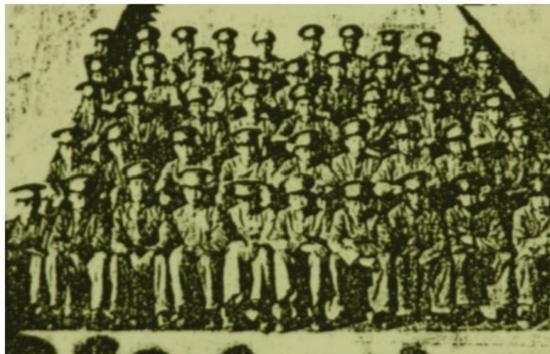
高中普通科一年级