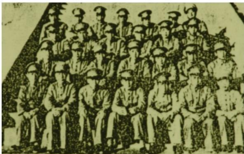
高中普通科三年级