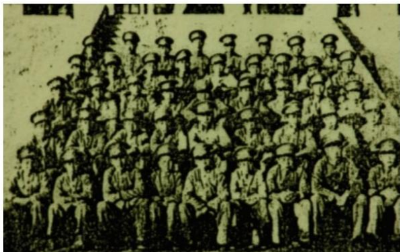
初中普通科三年级