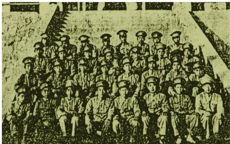
初中应化科三年级