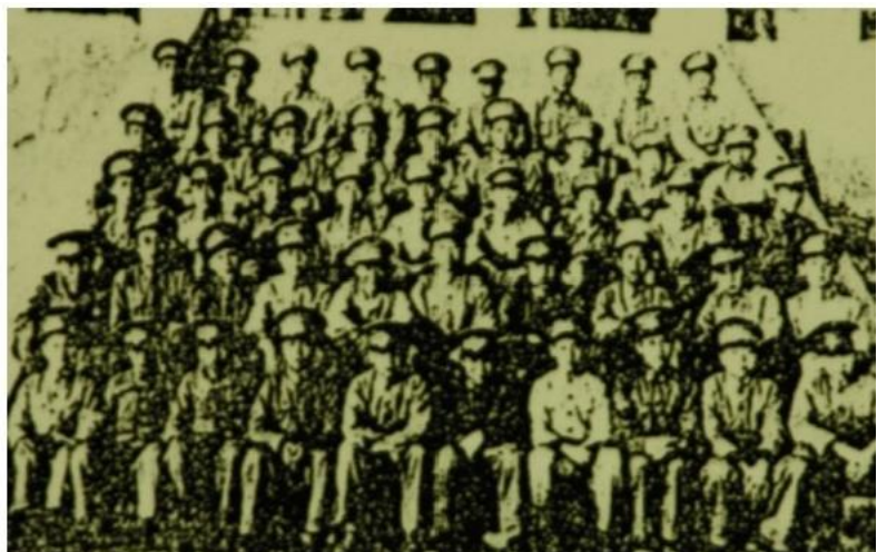
初中普通科二年级