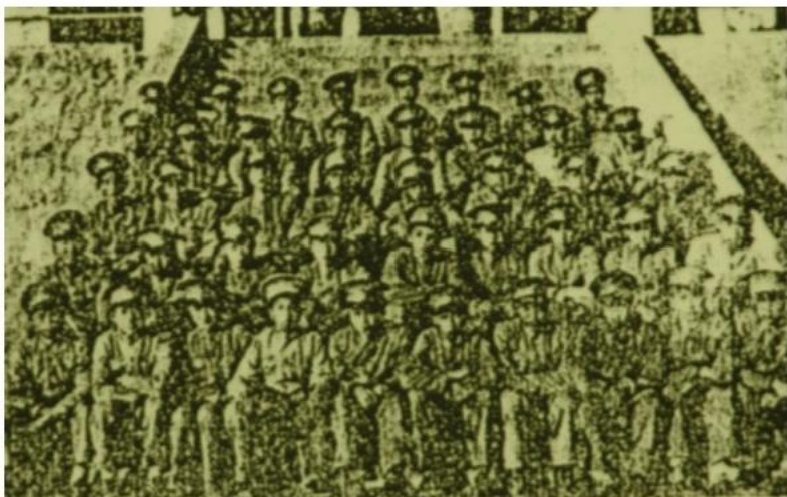
高中普通科二年级