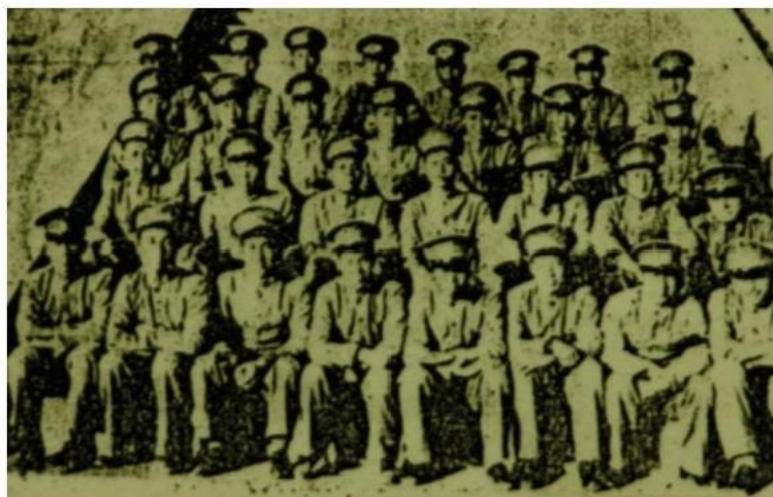
高中应化科三年级